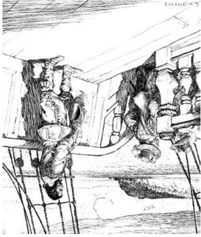
Champlain retenu captif sur le bateau de Kirke.

Les circonstances liées à sa capture par les frères Kirke et sa coopération avec ces derniers reste imprécise. Nous savons qu'en 1628, il a été capturé sur le chemin au retour du Québec, et que la ville de Québec avait capitulé devant les Kirke en 1629.