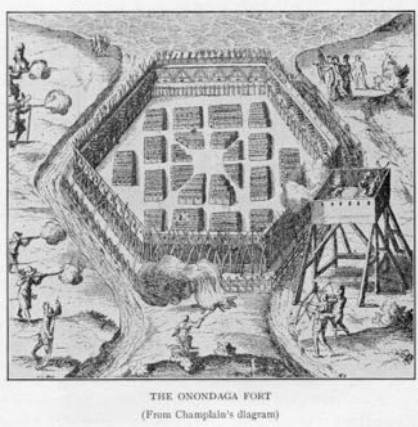
Fort Iroquois dessinée par Champlain.

En Septembre 1615, De Champlain et le clan des Wendat prévirent une attaque conjointe sur une forteresse Onondaga Iroquoise. Brûlé se porta volontaire pour aller dans le sud avec un groupe de Wendats pour apporter des renforts à partir d'un village allié. Il est arrivé trop tard pour aider et De Champlain car il avait déjà quitté les lieux, deux jours plus tôt, après avoir pris une flèche dans le genou.